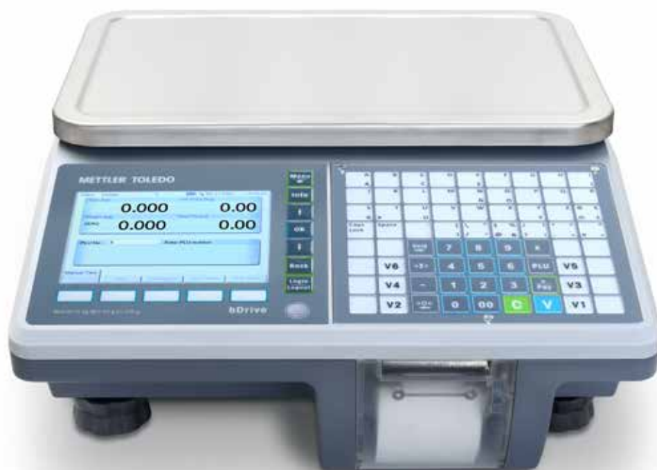
Balance compacte bDrive

Effectuant des pesées rapides et précises, le système bDrive de METTLER TOLEDO est une balance de comptage polyvalente multifonctions avec imprimante ticket, destinée à un usage en magasin ou en itinérance. Se démarquant par sa rapidité et sa robustesse, la bDrive effectue des processus de pesage complets et performants qui réduisent les temps d'attente des clients, même dans les environnements difficiles.